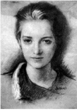
Farbstift- Zeichnung aus der Frau