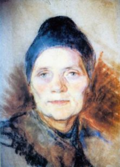
Farbstift-Zeichnung aus der Mutter /27,5×38,5, Pastell, Papier/