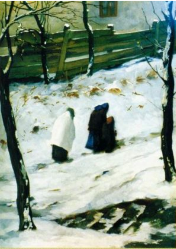
Winterstraßenteil /50×70 cm, Öl, Karton/