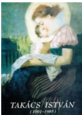
Matyó Madonna (Tietelseite)

Auf die Ehre des 100. Jahrestag von József Dala und István Takács Geburt eingeordneter nach den Katalog des Sammelausstellungen.