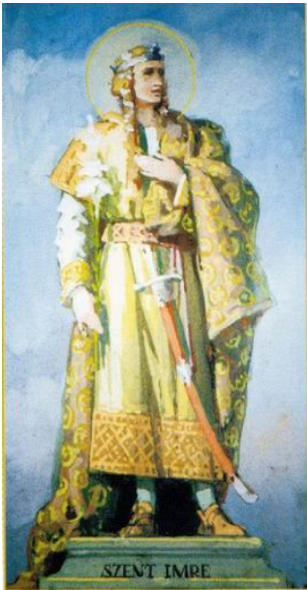
Szent Imre (színvázlat) /13×28 cm, Tempera, Karton/