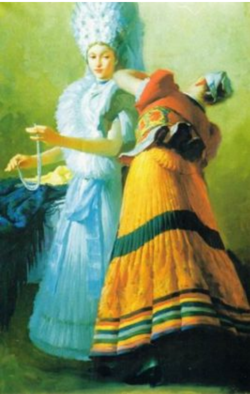
Braut Kostümierung /120×170 cm, Öl, Leinen/