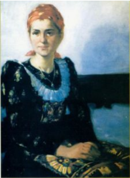
Matyó Braut in einem Kopftuch /60×80 cm, Öl, Leinen/