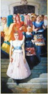
Am Sonntag aus einer hohen Massel /75×150 cm, Öl, Leinen/