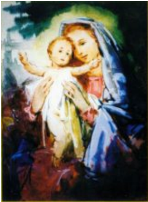
Madonna (Farbenskizze) /14,5×10,5 cm, Aquarellfarbe, Tempera, Papier/