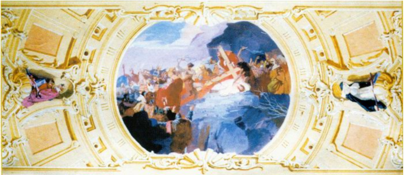
Der angezogener Plan zur Saint Anna irche von Miskolc /63×20 cm, Tempera, Karton/