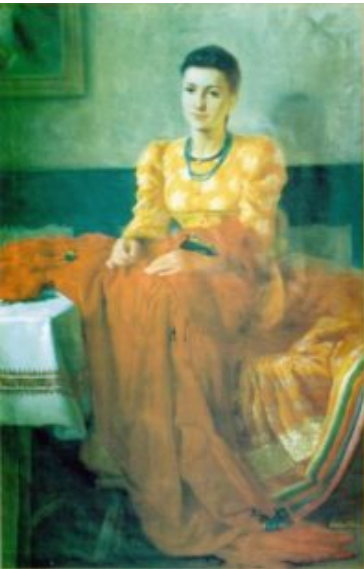
Matyó Mädchen mit einem roten Tuch /95×143 cm, Öl, Leinen/