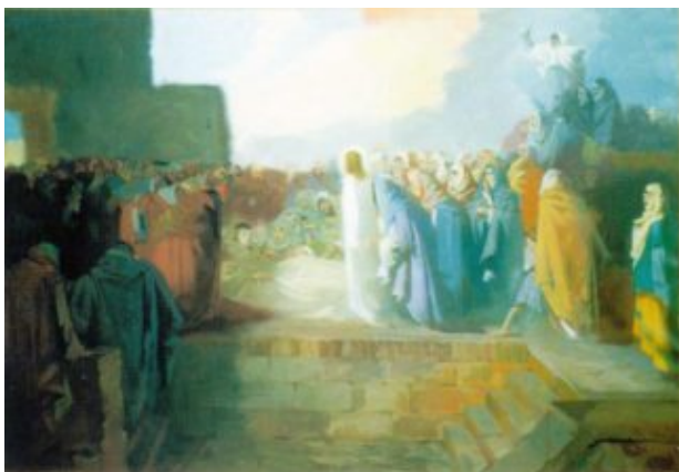
Wundereintrag von Jesus /100×70 cm, Öl, Leinen/