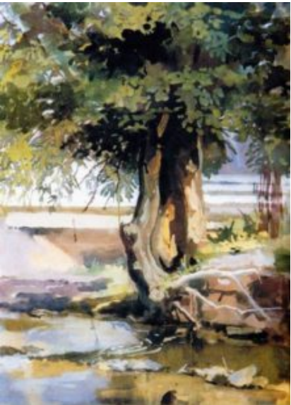
Alter Baum auf dem Ufer /30×40 cm, Tempera, Karton/