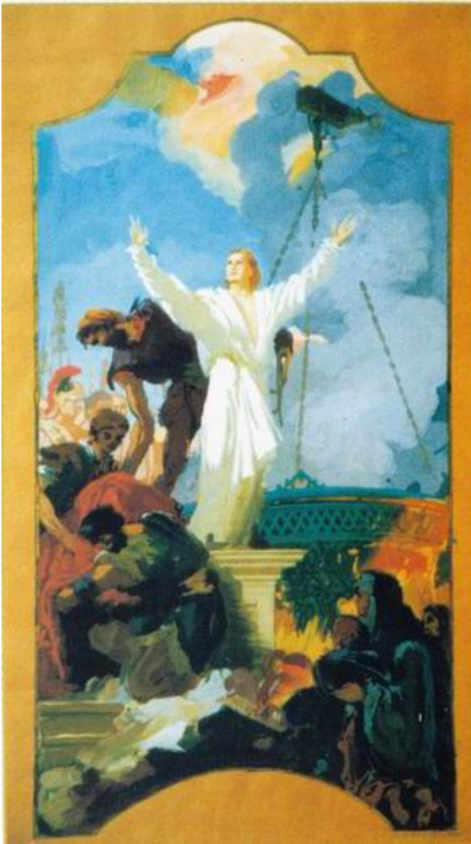
In Öl gekochte St. János (Farbenskizze) /20×50 cm, Tempera, Karton/