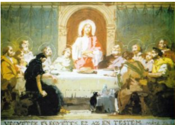
Das letzte Abendessen (Farbenskizze) /30×22 cm,