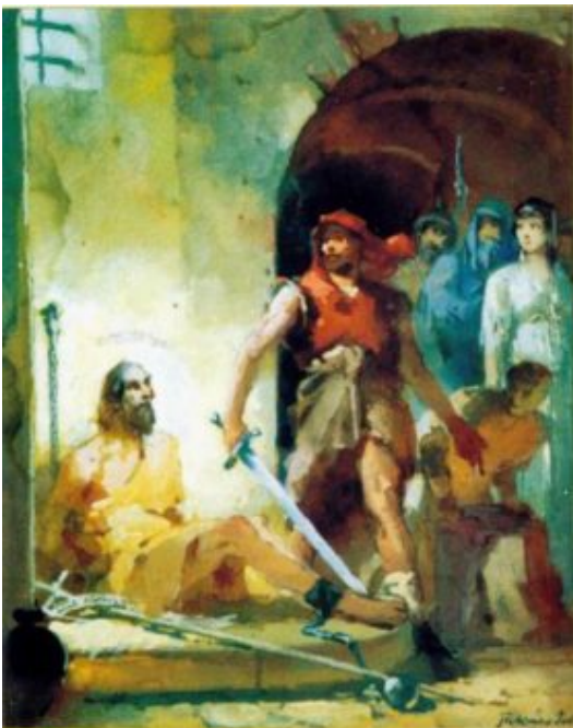
Taufest Saint János im Kerker /18×22 cm, Tempera, Karton/