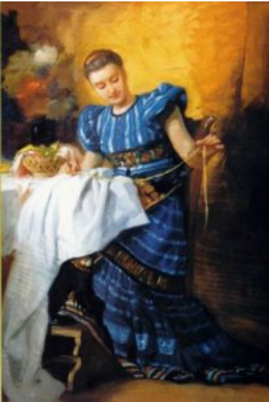
Stickendes Mädchen /40×60 cm, Sperrholz, Öl/