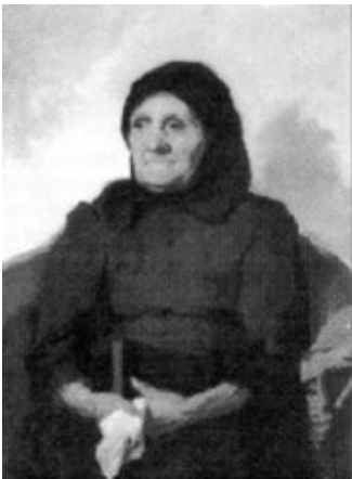
Das Bildnis seiner Mutter (Ölgemälde)