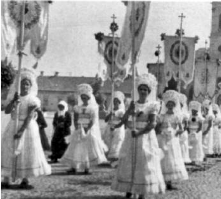
Mária lányok a búcsúi körmenetben