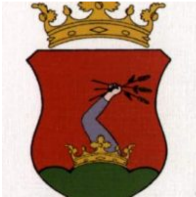
Mezőkövesd város címere

A húszezer lakosú város Észak-Magyarországon, Borsod-Abaúj-Zemplén megyében, a fővárostól 130, a megyeszékhely Miskolctól 45 kilométerre, Egertől 20 km-re, a Budapest-Miskolc vasútvonal, a 3. számú főútvonal és az M3-as autópálya mellett kerül el.