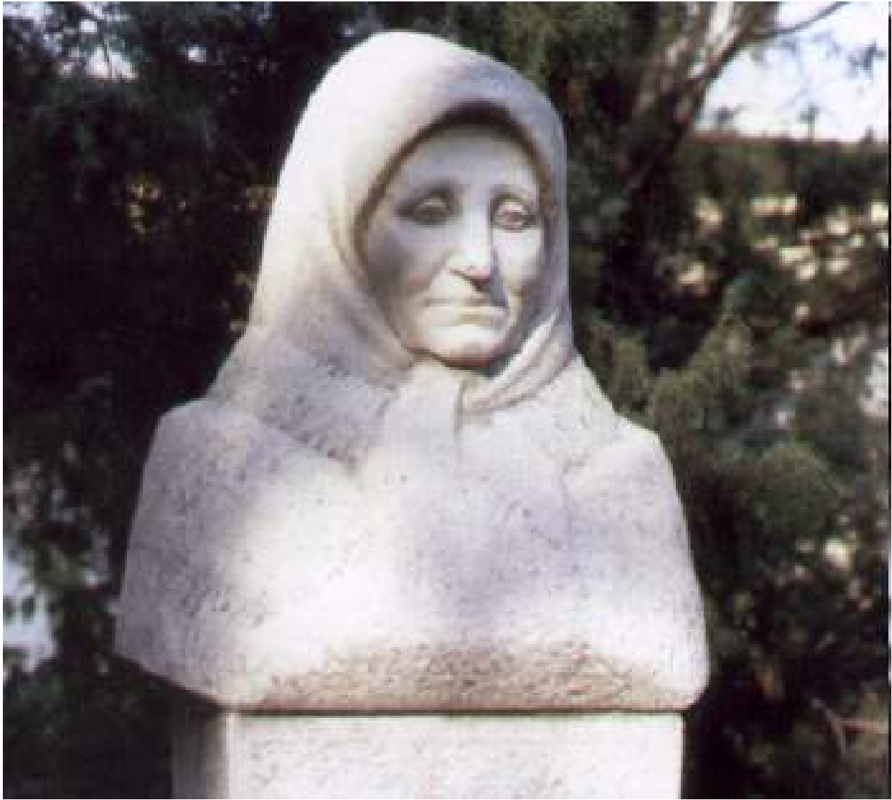
Kisjankó Bori szobra a Matyó Múzeum előtt