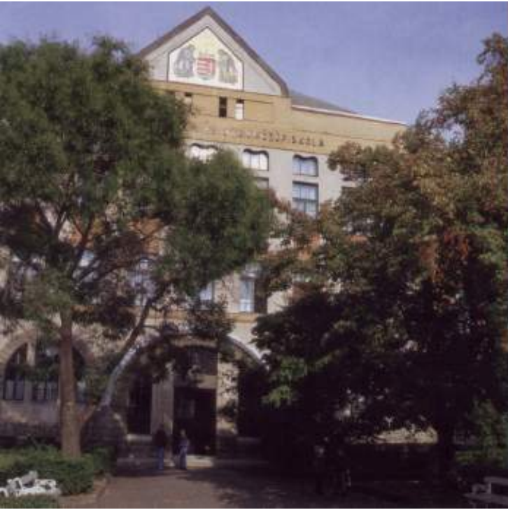
Szent László Gimnázium és Szakközépiskola