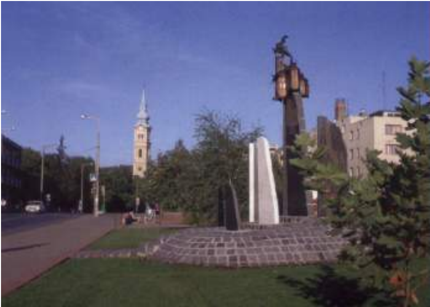
1956-os emlékmű a város főterén