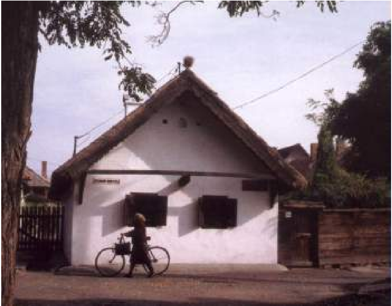
Kisjankó Bori emlékháza

meggyőzőbben, több oldalról is tükrözi Dala József (1901-1985) a másik első generációs művész életműve. Ő ugyanis idegenből, a Dunántúlról szakadt ide, mint a gimnázium rajztanára. Ám aztán egész hosszú életében rabja maradt a matyó élet vonzásának.