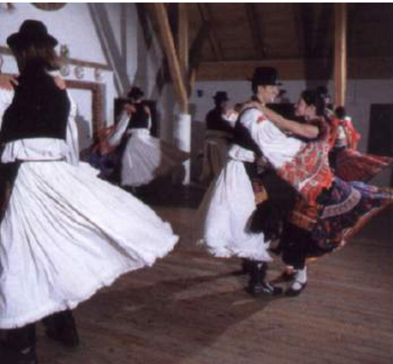
A Matyó Együttes táncbemutatója