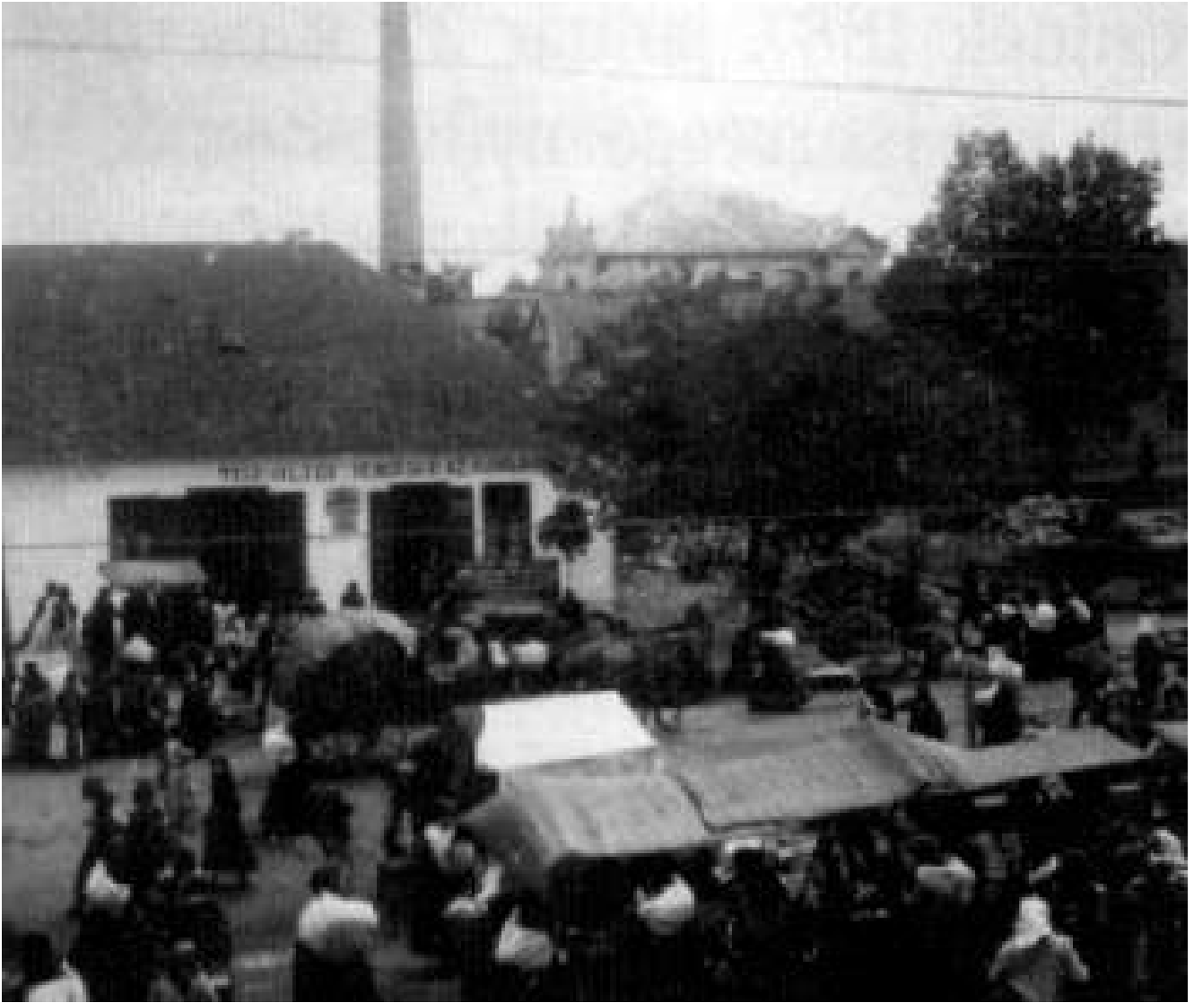
A Tűzoltó vendéglő az új világhoz Kövesd főterén