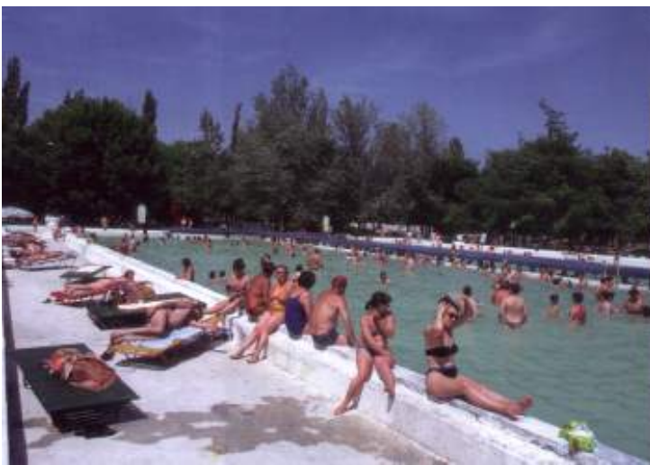
A Zsóry fürdő medencéje

A gyógyfürdőn túl, gondozott, virágos parkok között, fedett és nyitott gyógymedencék, uszoda és hullám-körmedencék szolgálnak fürdésre. A gépkocsival érkezők igénybe vehetik az autós-kemping szolgáltatásait is. A fürdő környékén, az "üdülőtelepen" a szállás- és étkezési lehetőségek egyre bővülnek.