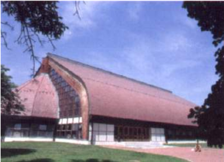
A fedett uszoda épülete