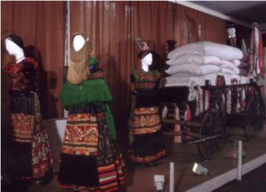
A Matyó Múzeum belső terme