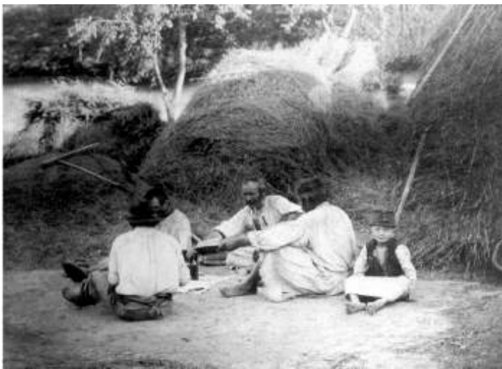
Ebédelő matyó summások

A lakosság szívósságára jellemző, hogy aránylag gyorsan felocsúdik, a XVIII: század közepe táján már kétszáz családnév ismert, s az ónodi helyett az egri járáshoz tartozik. 1848-ban 7823 katolikus és 92 izraelita személy lakta. S ekkor, a kápolnai csatából visszahúzódó honvéd sereg a város határában "sikeres utóharcot vívott".