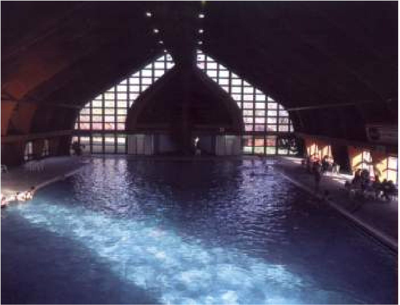
Az uszoda belülről