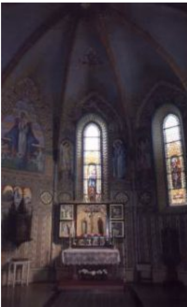
Gótikus kápolna a XV. századból a Szent László katolikus templomban