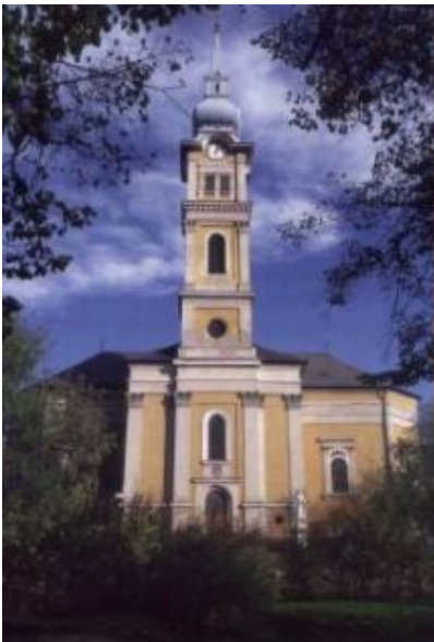
Szent László római katolikus templom