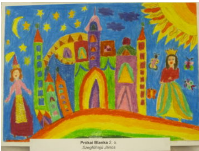
Prókai Blanka 2. o. Szegefűhajó János