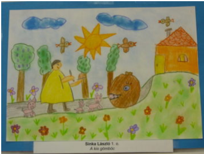
Sinka László 1. o. A kis gömböc