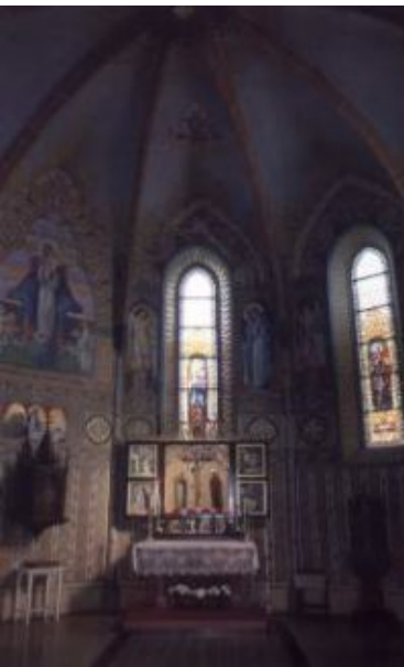
Gótikus kápolna a XV. századból a Szent László katolikus templomban