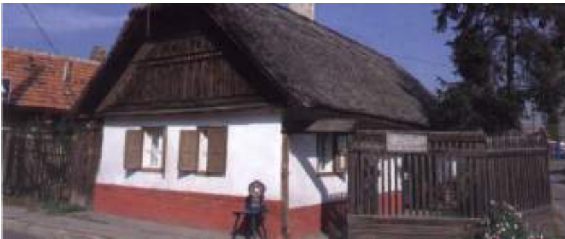
Bútorfestő – védett népi épület a Hadasban

A Szent László tértől búcsúzva utunkat a Mezőkövesd hajdani arculatát leginkább őrző városrész, a matyó főváros "rezervátuma" felé vesszük. A településrész szerkezete és egyes épületei másfél, két évszázad távlatából hitelesen őrzik a matyóság építő tevékenységét, az anyag a szerkezet és a forma összhangját, az egykori életformát, a terület hangulatát. a festői " Hadas " terület az apró telkekkel, a szabálytalanul kanyargó utcákkal, közökkel, kis teresedésekkel sajátosan mezővárosias.